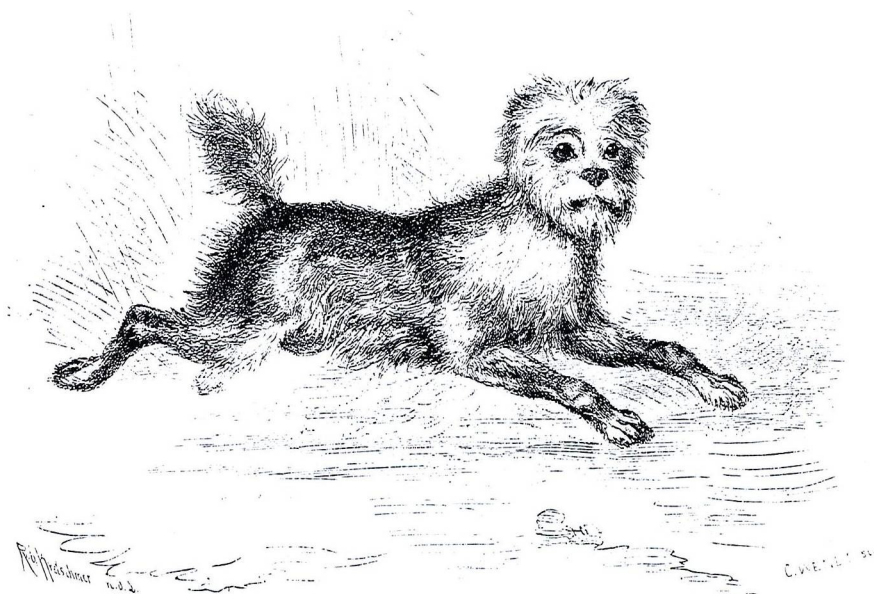
Abb. 55 Affenpinscher aus A. E. Brehm, Illustriertes Thierleben , 1864