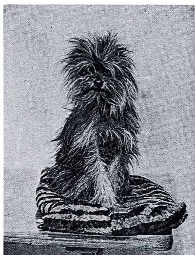
Abb. 56 Affenpinscher »Fatzke«, 1890, Eig. Max Hartenstein

Rodunomainen apinapinseri on pieni ja neliömäinen koira, jonka ulkomuoto muistuttaa griffon bruxelloisea, trimmausta lukuun ottamatta. Apinapinsерillä on pyöreähkö pää, mutta ei kuitenkaan ylösvetäytynyt kuono eikä yhtä lyhyt kuin griffoneilla. Selkä on suora ja kulmaukset ovat kohtuulliset. Karva on karkea ja tiivis sekä päässä joka suuntaan sojottavaa. Apinapinsерillä on alapurenta, mikä antaa apinamaisen ilmeen.