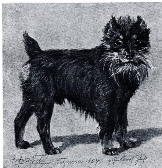
Abb. 58 Affenpinscher aus dem Jahre 1904, gezeichnet von R. Strebel